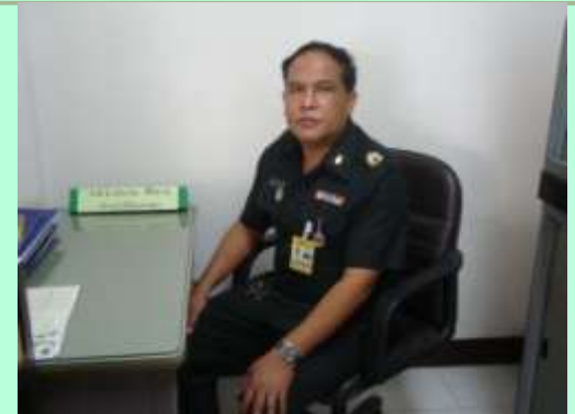
จ.สบ.ประจวบ ศิริทาน

นายสิบพยาบาลธุรการ , เวชระเบียน, ซ่อมบำรุง