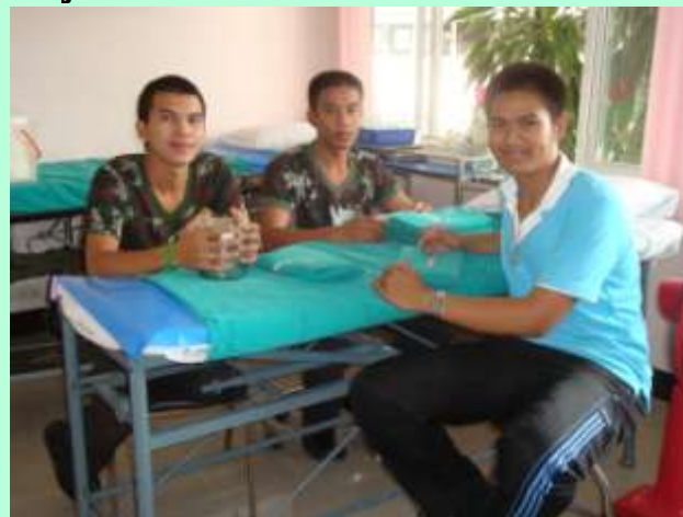
พลทหารประจำหน่วย

นายสิบพยาธิทำหน้าที่จ่ายยาดูแลสถานที่สิ่งแวดล้อม